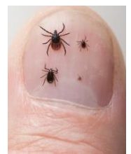
Figuur 1: teken in verschillende maten

Hiernaast staan enkele afbeeldingen van huidverkleuringen die op kunnen treden na een tekenbeet. Heb je na een tekenbeet deze symptomen raadpleeg dan