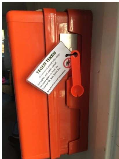
Figuur 2: EHBO-koffer